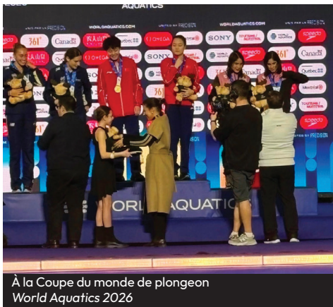
À la Coupe du monde de plongeon World Aquatics 2026