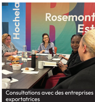
Consultations avec des entreprises exportatrices