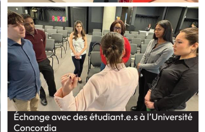
Échange avec des étudiant.e.s à l'Université Concordia