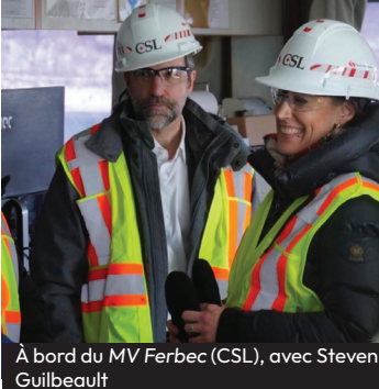
À bord du MV Ferbec (CSL), avec Steven Guilbeault