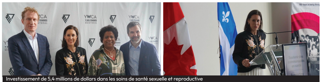
Investissement de 5,4 millions de dollars dans les soins de santé sexuelle et reproductive