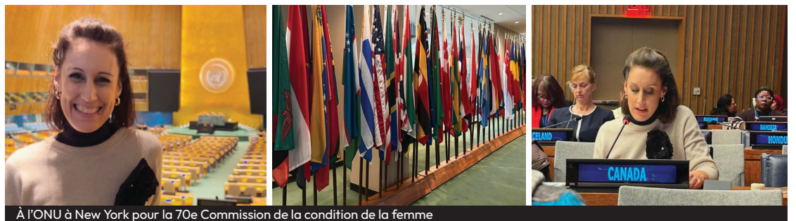
À l'ONU à New York pour la 70e Commission de la condition de la femme