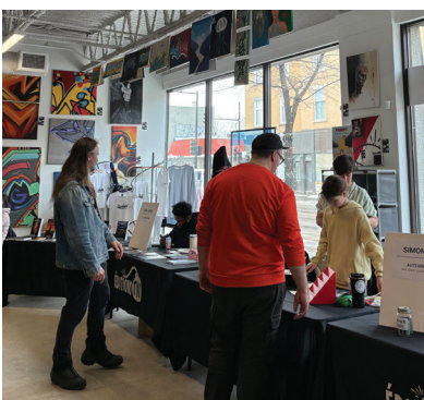
Au Salon du livre des jeunes auteur(e)s et illustrateur(trice)s, organisé par le Café Graffiti et les Éditions TNT