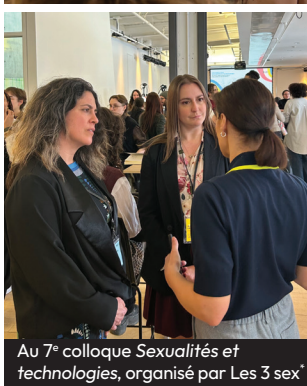
Au 7e colloque Sexualités et technologies, organisé par Les 3 sex*