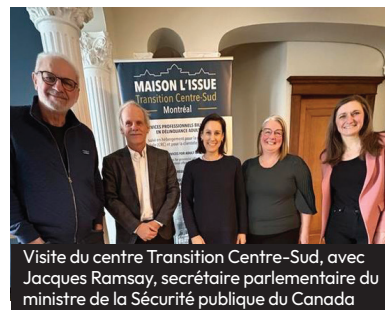
Visite du centre Transition Centre-Sud, avec Jacques Ramsay, secrétaire parlementaire du ministre de la Sécurité publique du Canada