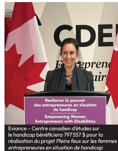
Renforcer le pouvoir des entrepreneures en situation de handicap Empowering Women Entrepreneurs with Disabilities Eviance – Centre canadien d'études sur le handicap bénéficiera 797 557 $ pour la réalisation du projet Pleins feux sur les femmes entrepreneures en situation de handicap