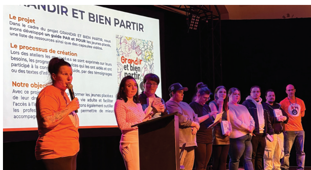
Le projet GRANDIR ET BIEN PARTIR Dans le cadre du projet GRANDIR ET BIEN PARTIR, nous avons développé un guide PAR ET POUR les jeunes, une liste de ressources ainsi que des capsules vidéo. Le processus de création Lors des ateliers les jeunes ont exprimé leurs besoins, les professionnels qui les ont aidés et ont participé à la conception du guide, par des témoignages ou des textes d'accompagnement. Notre objectif Avec ce projet, nous voulons offrir aux jeunes un accès à l'information, leur permettre de mieux connaître les services disponibles et leur offrir un soutien et un accompagnement adaptés à leur situation.