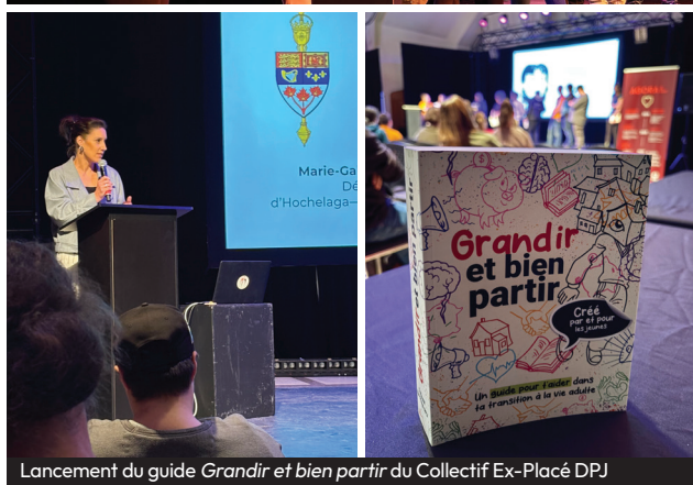
Lancement du guide Grandir et bien partir du Collectif Ex-Placé DPJ