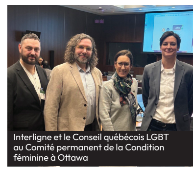
Interligne et le Conseil québécois LGBT au Comité permanent de la Condition féminine à Ottawa