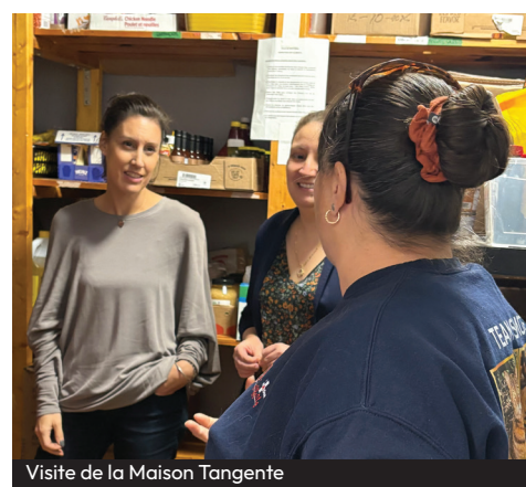
Visite de la Maison Tangente