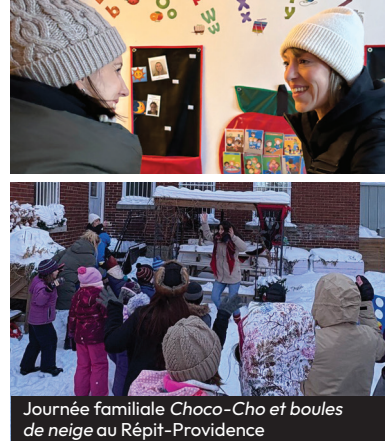
Journée familiale Choco-Cho et boules de neige au Répît-Providence