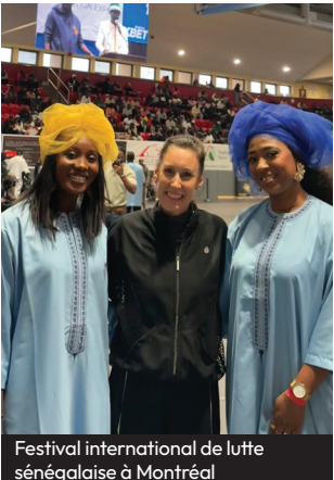
Festival international de lutte sénégalaise à Montréal