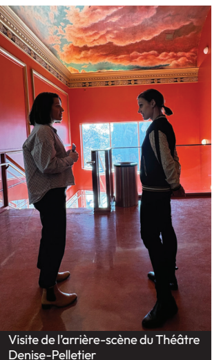
Visite de l'arrière-scène du Théâtre Denise-Pelletier