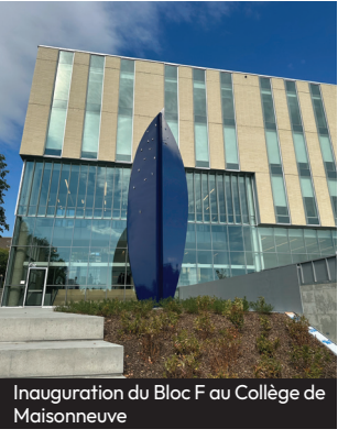
Inauguration du Bloc F au Collège de Maisonneuve