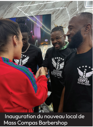
Inauguration du nouveau local de Mass Compas Barbershop