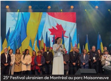
25 e Festival ukrainien de Montréal au parc Maisonneuve