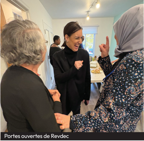
Portes ouvertes de Revdec