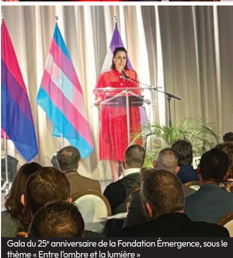
Gala du 25 e anniversaire de la Fondation Émergence, sous le thème « Entre l'ombre et la lumière »