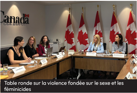
Table ronde sur la violence fondée sur le sexe et les féminicides