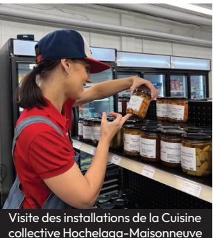
Visite des installations de la Cuisine collective Hochelaga-Maisonneuve