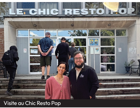
Visite au Chic Resto Pop