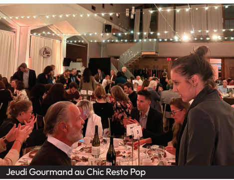
Jeu de Gourmand au Chic Resto Pop