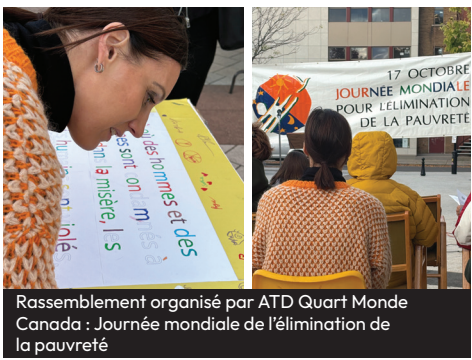
Rassemblement organisé par ATD Quart Monde Canada : Journée mondiale de l'élimination de la pauvreté