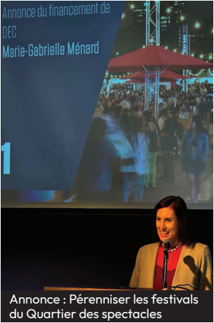
Annnonce : Pérenniser les festivals du Quartier des spectacles