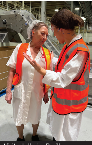
Visite de l'usine Barilla