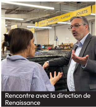
Rencontre avec la direction de Renaissance