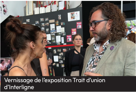
Vernissage de l'exposition Trait d'union d'Interligne