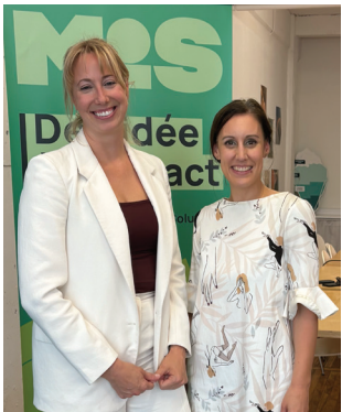
Rencontre avec la direction de la Maison de l'innovation sociale