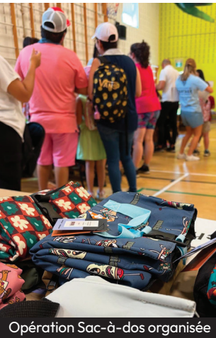
Opération Sac-à-dos organisée par Je Passe Partout