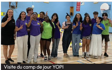
Visite du camp de jour YOPI