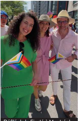
Défilé de la Fierté à Montréal