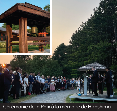
Cérémonie de la Paix à la mémoire de Hiroshima