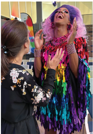
Conférence de presse du Festival Fierté Montréal