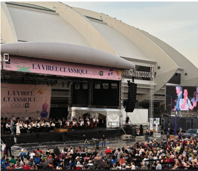
OSM sous les étoiles, sur l'Esplanade du Parc olympique