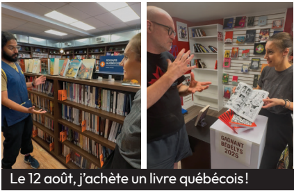
Le 12 août, j'achète un livre québécois!