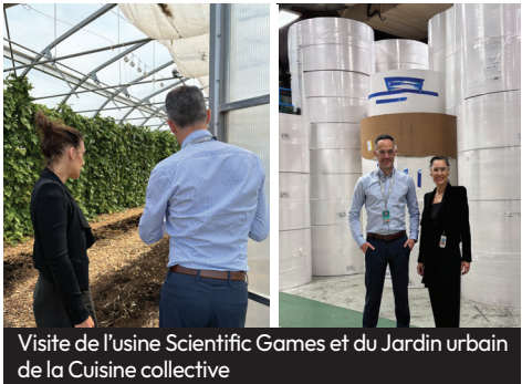
Visite de l'usine Scientifc Games et du Jardin urbain de la Cuisine collective