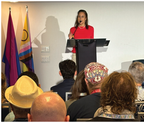
Ouverture de la 3 e conférence internationale d'Egides