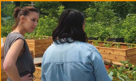
Le potager solidaire du Sentier Urbain | RAHMA