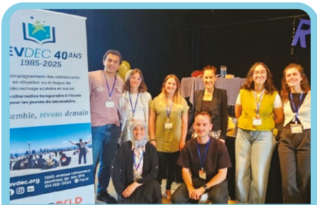
Le 40 e anniversaire de REVDEC