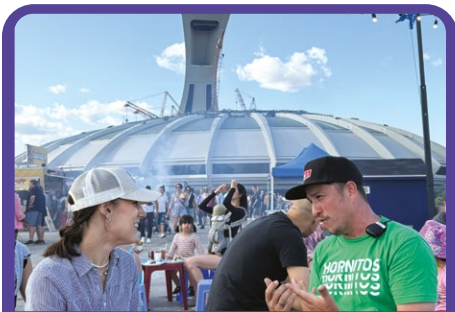
Les Premiers Vendredis