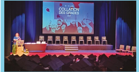
La cérémonie de collation des grades 2025 au Collège de Maisonneuve