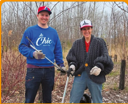
La Corvée du boisé Steinberg