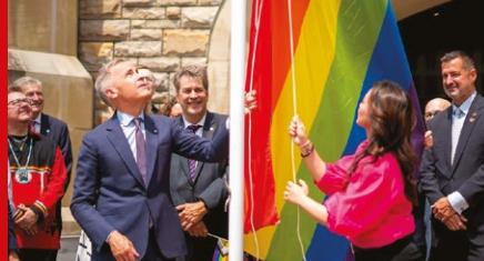
Levée du drapeau de la Fierté