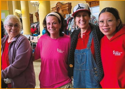
Le Bazar du Centre communautaire Hochelaga