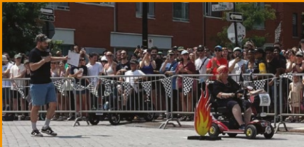
La Course des Glorieux Triporteurs