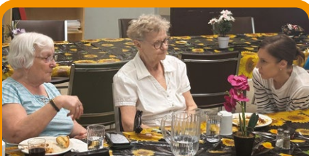
Le Gala des tournesols de Résolidaire