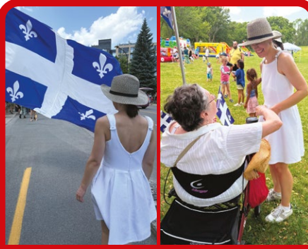
Fête de la Saint-Jean-Baptiste