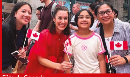
Fête du Canada